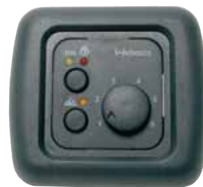
Diesellocher X 100 Bedienelement