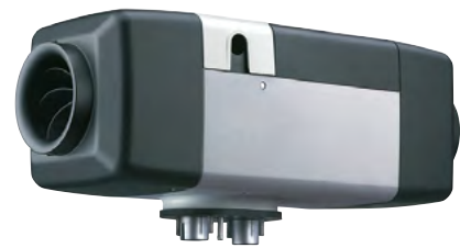
Air Top Evo 40 oder 55